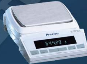
PB 153-S/FACT PB 303-S/FACT