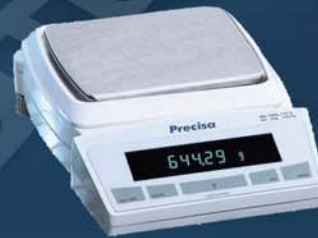
PB 153-S/FACT PB 303-S/FACT